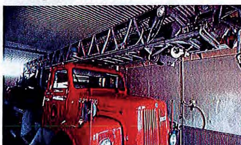
Stegbil årsmodell 1976