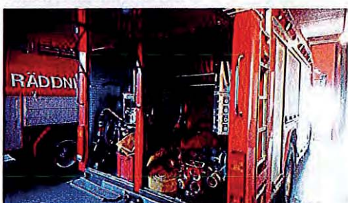
Släckbil årsmodell 2008