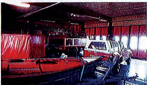
Servicebil årsmodell 2003

Ludvika kommun tillhandahåller fordon åt Ljusnarsbergs kommun. Detta ingår i avgiften för Ljusnarsberg utan att denna del är särskilt specificerad.