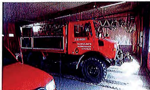
Terrängbil årsmodell 1989