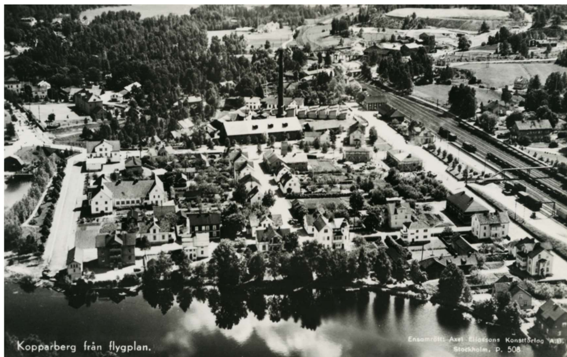
Flygfoto över Kopparberg med station och industri i bild, år 1939.

Ett centrumstråk utvecklades invid järnvägsstationen och utmed Konstmästaregatan med bostadshus i gatuliv och trädgårdar inåt kvarteren. Vid järnvägen anlades också under tidiga 1900-talet bostadsområdet Brovreten i ett tidstypiskt planmönster med en esplanad mot järnvägen och egna-hemsvillor i 1½ våning. Under den första halvan av 1900-talet så förtätades staden med industrier, flerbostadshus och villabebyggelse i stadens ytterkanter. Dessa är tydligt representerade i de östra delarna av Kopparberg. Men, under den andra halvan av 1900-talet så läggs många industrier ner och sedan 1970-talet har staden haft en negativ befolkningstrend (Länsstyrelsen Örebro län, 2012). Detta speglas i stadsbebyggelsen då byggnader uppförda efter 1970 är få till antalet.