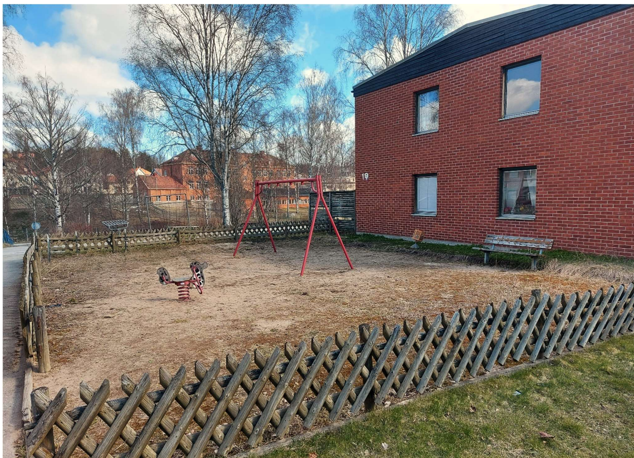
Bild ovan: Väringsmöjligheter för textilier och mattpiskeställning. Bild nedan: Lekplats inom området. Eftersatt underhåll. Båda platserna har utsikt mot ån och den gamla skolan från 1920-talet.