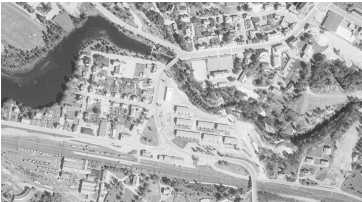
Flygfoto från ca 1975. De nybyggda bostäderna i kvarteret Krokfors är nu på plats. Strax väster om byggnaderna syns den nya brandstationen placerad i vinkel.