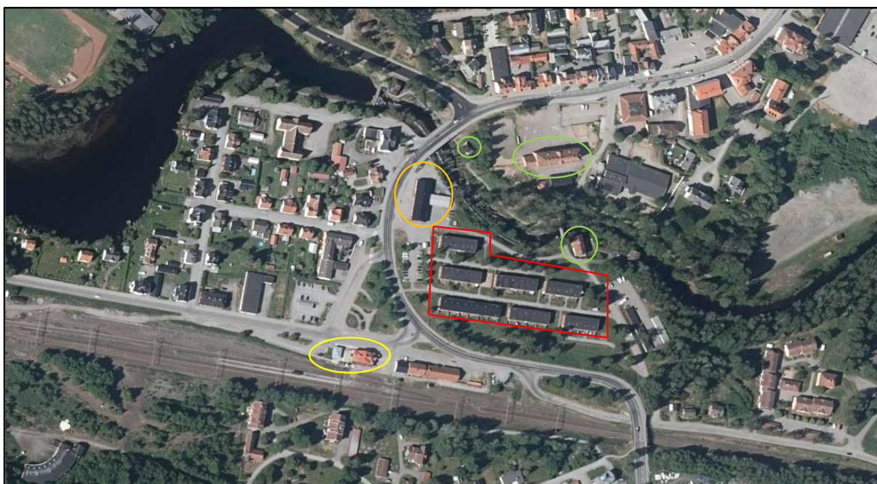
Rött område – Krokfors flerbostadshus. Gult område – Den gamla järnvägsstationen och nuvarande busstation. Orange område – Brandstationen. Grönt område – Lyshuset, korsvirkesteknikhuset och Garhytteskolan. Flygfoto 2018.

Norr om bostadsområdet forsar Garhytteån fram, och precis intill vattnet så står ett reveterat hus som uppfördes 1903 av Kaveltorps elverk det s.k. "Lyshuset". På andra sidan ån ser man den gamla Garhytteskolan från 1920-talet samt en äldre mindre byggnad i korsvirkesteknik som tidigare tillhörde Krokfors gjuteri (ÖLM, 1992). Konstmästaregatan slingrar sig sedan norrut in mot centrum och kantas av äldre bebyggelse från 1900-talets början med butikslokaler i bottenplan, bostäder på den andra våningen och öppna gårdar i kvarter bakom byggnaderna.