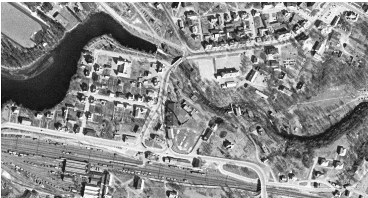
Flygfoto från ca 1960. Här syns den tidigare bebyggelsen som senare kom att rivas.