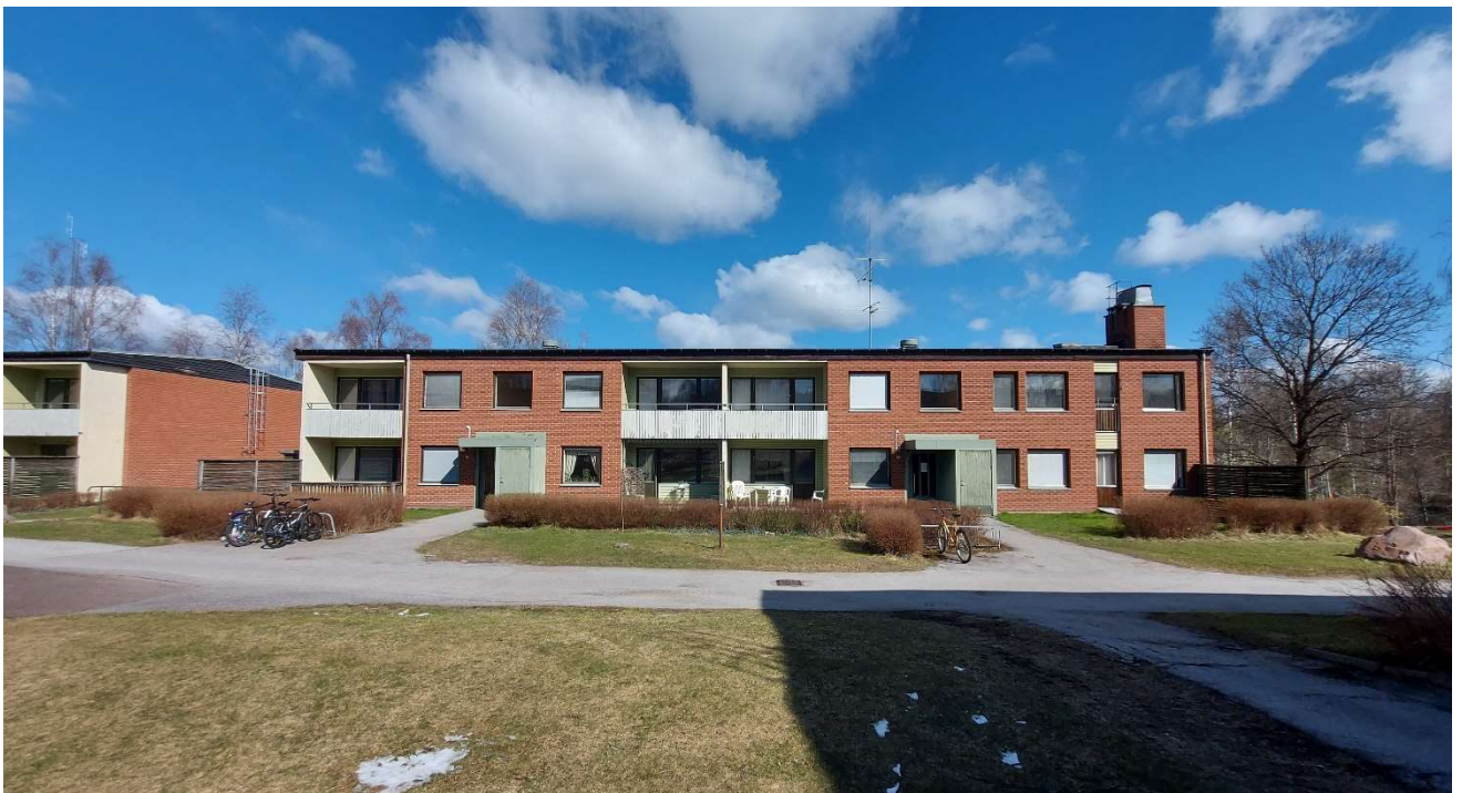
Några av bostadshusen inom området från sydostlig och sydlig vinkel.