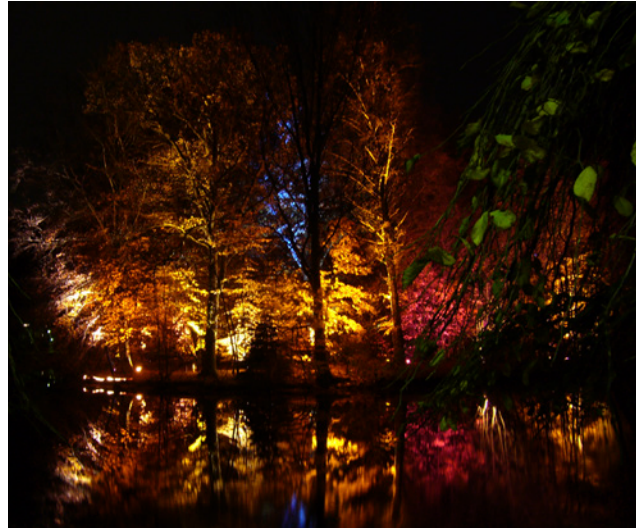
Exempel på ljussättning av vegetation

Inom området bör offentlig konst, såsom ljussättning av vegetation och lekskulpturer, placeras ut.