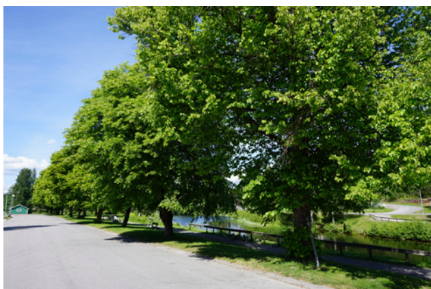
Allé längs Rostvändaregatan

Inom planområdet finns ett antal alléer, både ensidiga och dubbla. Dessa finns bl.a. längs Allévägen, Kanalvägen, Kata Dalströms väg, Klotbanevägen, Klottorp, Konstmästaregatan, Kyrkvägen, Laxbrogatan, Malmvägen, Missionhusvägen, Rostvändaregatan, Stockbacksvägen, södra sidan av järnvägen vid resecentrum och vägen in till Bångbro industriområde.