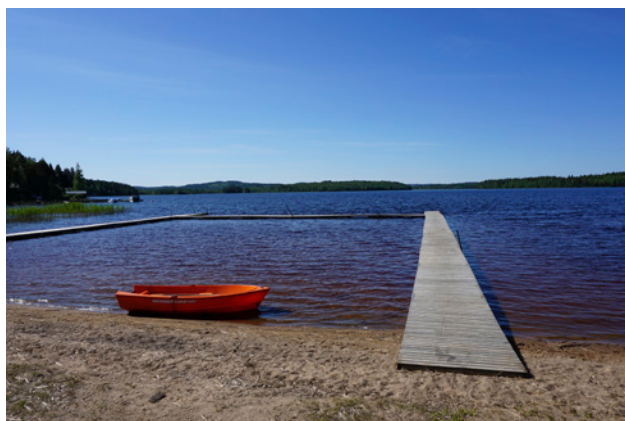
Badplats vid Ljusnarens östra strand

I anslutning till badplatsen vid Ljusnarens östra strand finns beachvolleybollplan, lekplats och grillplats. Vidare sträcker sig Bergslagsleden förbi badplatsen.