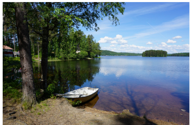
Badplats vid Olovsjöns södra strand

Skyltar bör sättas upp med information om de natur- och kulturvärden som finns inom området.