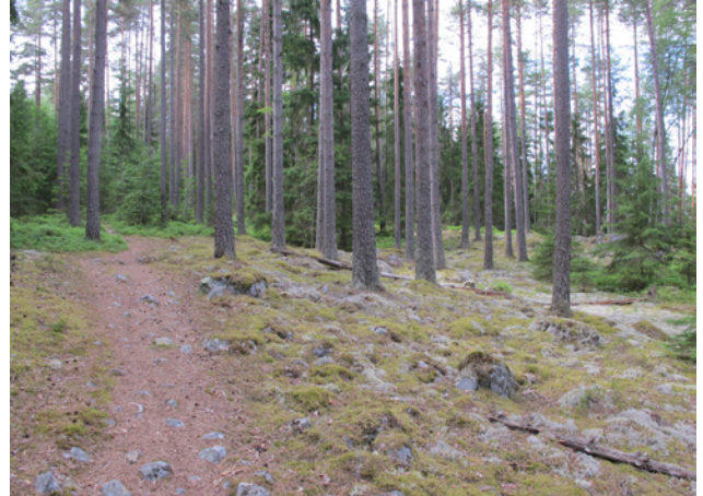
Barrskog inom naturreservatet Finnkullberget

Inom planområdet finns fem registrerade nyckelbiotoper. Nyckelbiotopen inom naturreservatet Finnkullberget utgörs av barrnattskog. Inom området finns rikligt med död ved, värdefull kryptogamflora och ymnigt mosstäck.