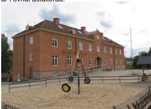
Del av Garhytteskolans skolgård

Garhytteskolans skolgård utgörs bl.a. av en grusplan och lekplats. Stora delar av skolgården är i övrigt asfalterad.