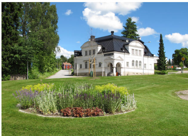
Plantering i Trekanten

Parken är lätt att nå och kvaliteten på områdets rekreativvärden bedöms vara medelhög. Trekanten bedöms ha rekreativvärde klass 2, dvs. vara värdefull för tätorten.