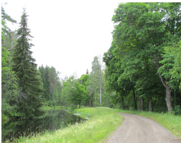
Allé längs Bångbro kanal

Alléerna består främst av björk, lönn, asp, salix, klotpil, oxel och lind.