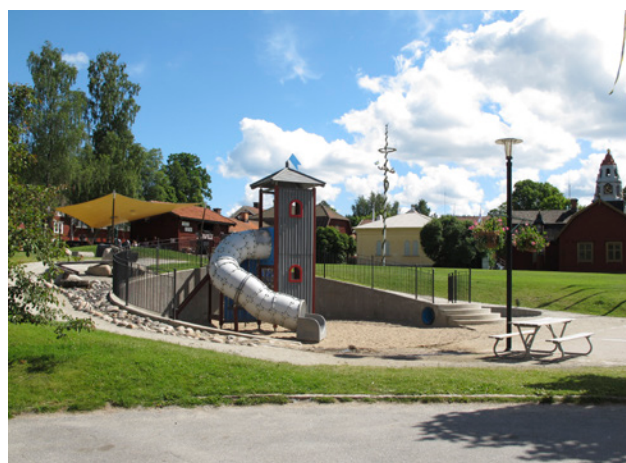
Lekplats på Malmtorget

Vidare finns en lekplats på Malmtorget och en lekplats vid badplatsen vid Ljusnarens östra strand. I övrigt ligger lekplatserna inom eller i anslutning till olika bostadsområden.