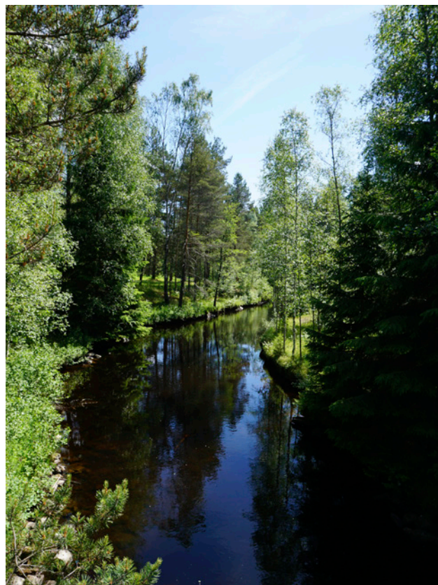
Garhytteån genom Rydbergsdal

Inom planområdet har åtta helhetsområden identifierats. Dessa är Prästön, Orrbacksmossen, Funkhagen, Garhytteån, Ljusnarsbergs gruvfält, Laxtjärn, Finnkullberget och Kaveltorps gruvfält. För respektive område redovisas förslag på hur områdena strategiskt kan användas, skötas samt utvecklas i framtiden.