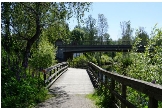
Strandpromenad längs Garhytteån

På norra sidan av Garhytteån, i anslutning till riksväg 63, finns en anlagd strandpromenad som delvis utgörs av spänger.