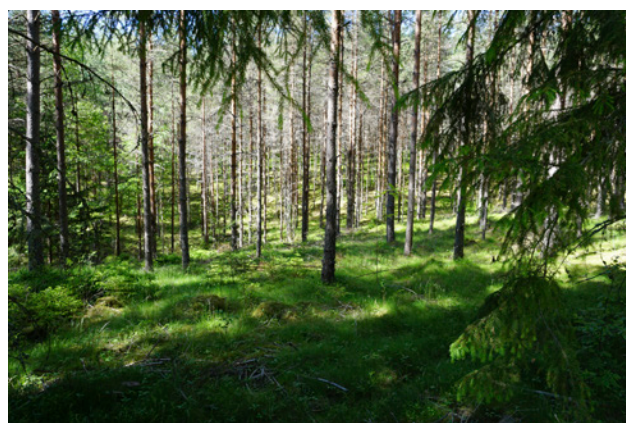
Tallskog inom Funkhagen

Området bedöms ha naturvärdesklass 3, dvs. påtagligt naturvärde.