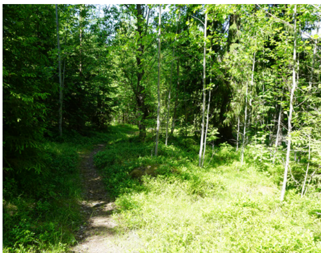
Stig vid Kaveltorps gruvfält