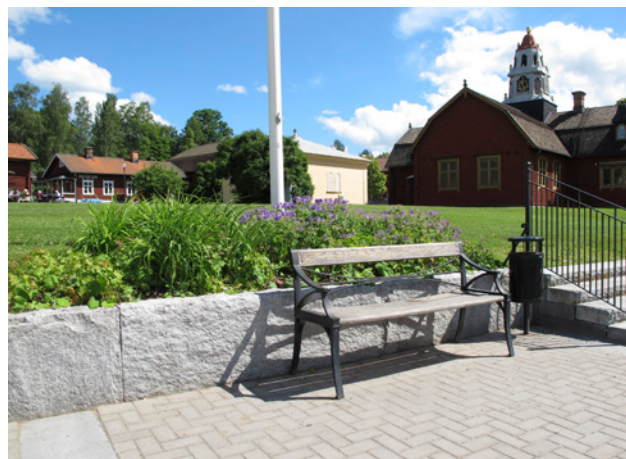
Plantering och sittplats i parken

Malmtorget utgör en park i centrala Kopparberg. Parken består av en stor öppen gräsyta i norr och en hårdgjord torgyta i söder. Inom området finns sittplatser, planteringar och en lekplats. Vidare finns ett café i norra delen av parken.