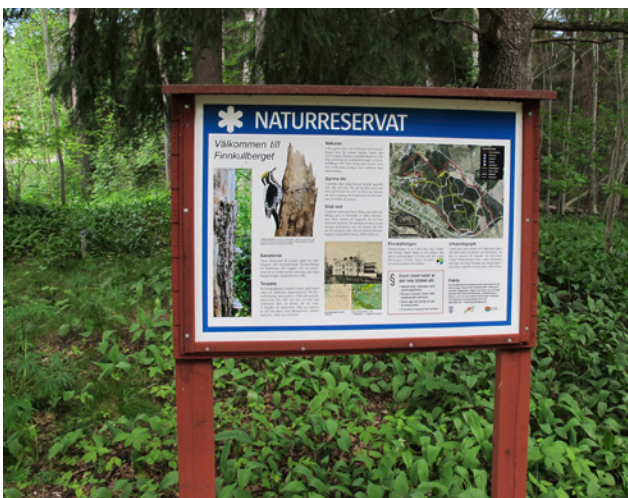
Skylt vid naturreservatet Finnkullberget

För att främja att så många som möjligt nyttjar den tätortsnära naturen ska den vara lätt att nå, speciellt för gång- och cykeltrafikanter. Dessutom ska det vara lätt att röra sig mellan de olika områdena och målpunkterna, främst till fots eller med cykel.