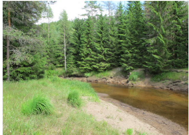
Garhytteån genom Bångbro

Området bedöms ha naturvärdesklass 2, dvs. högt naturvärde.