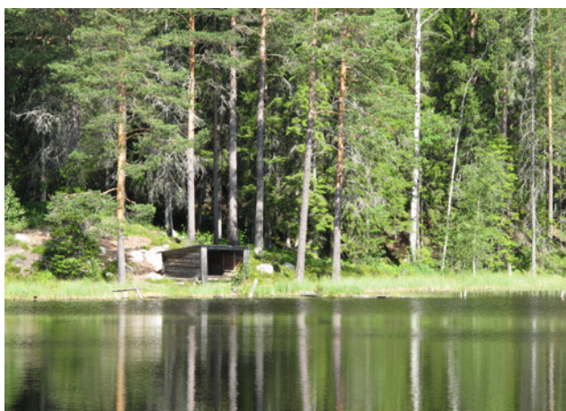
Vindskydd vid Laxtjärn

Områdena är relativt lätta att nå, men kvaliteten på områdenas rekreativvärden bedöms vara låg. Badplatserna bedöms ha rekreativvärde klass 2, dvs. vara värdefulla för tätorten.