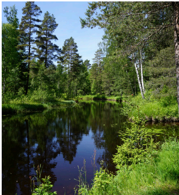
Gång- och cykelväg efterfrågas längs hela ån

Bland de öppna svaren angavs bl.a. att det saknas gång- och cykelvägar till bryggeriområdet, vid Ljusnarsbergs kyrka, mellan Kopparberg och Skäret samt längs hela Garhytteån.