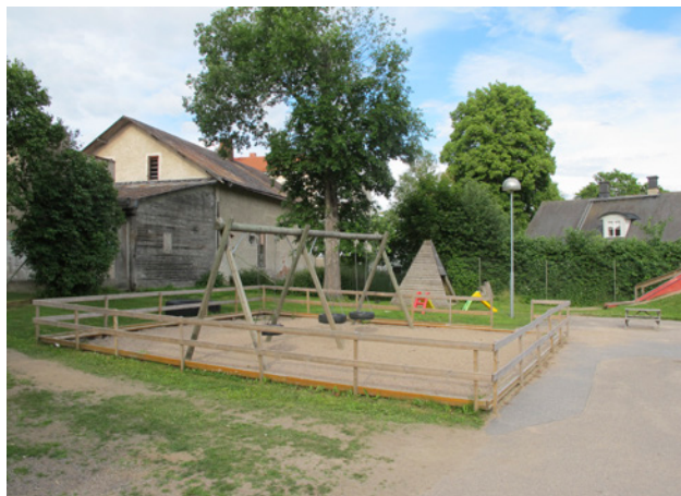
Del av lekplatsen vid Garhyttans förskola

Områdena är lätta att nå, både ovanstående och övriga lekplatser inom planområdet, men kvaliteten på områdenas rekreativsvärden bedöms vara låg. Lekplatserna bedöms ha rekreativsvärde klass 3, dvs. vara värdefulla för del av tätorten.