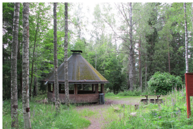
Utomhuspedagogik bör främjas inom naturreseptatet

Skyltar bör sättas upp med information om de natur- och kulturvärden som finns inom området.