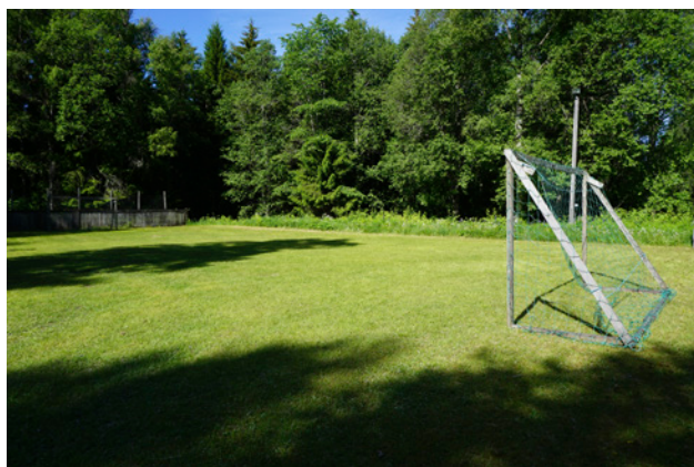
Fotbollsplan vid Lars-Ols-backe

Även på norra sidan av Garhytteån finns tre mindre fotbollsplaner. Vid Stråtvägen finns en liten öppen gräsyta med fotbollsmål. Gräsytan kantas av skog och i området finns fler upp-trampade stigar. Dessutom finns en liten öppen