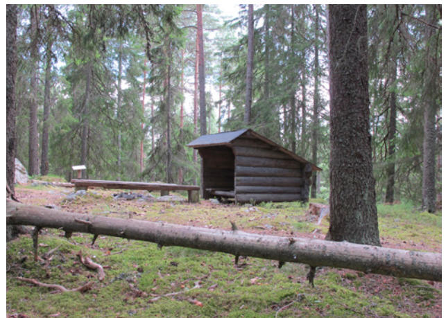
Eldplats i naturreservatet

Inom naturreservatet finns ett elljusspår och tre rastplatser med eldplatser. Vidare finns en stig, Finnkullstigen, som består av slingorna Laxbroslingan och Rävslingan. Stigen utgör en skolstig. Vintertid prepareras delar av spåren för längskidåkning.