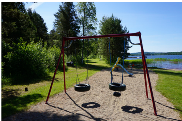
Lekplats vid Ljusnarens östra strand

Lekplatsen vid Kyrkbacksskolan inventerades i fält år 2015 och pekades ut i skolenkäten från år 2007. Lekplatsen omfattar bl.a. klätterställning och gungor.