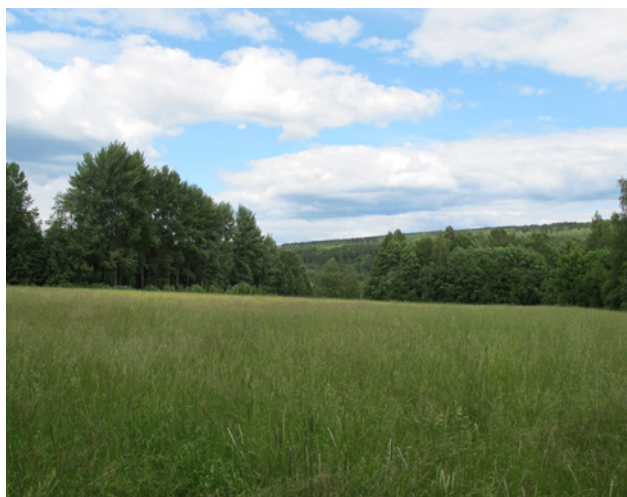
Ängsmark vid Daltorp

Inom planområdet finns två mindre ängsmarker, den ena vid Daltorp och den andra vid Ljusnars-bergs gruvfält.