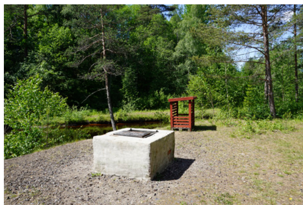
Grillplats i Rydbergsdal

Majoriteten av de som besvarade frågan ansåg att det främst krävs mer skötsel, information och sittplatser för att de ska använda kommunens parker och naturområden mer än i dag. Vidare efterfrågades markerade stigar, platser för sportaktiviteter, grillplatser och utomhusgym.