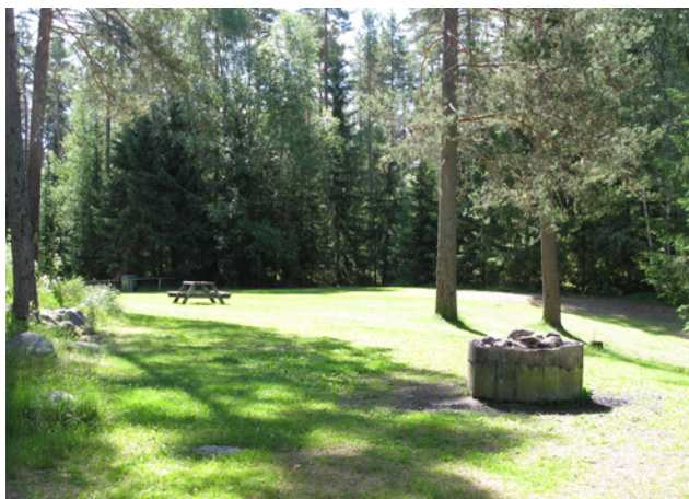
Drift och underhåll av grillplatsen är viktiga aspekter

Skyltar bör sättas upp med information om de natur- och kulturvärden som finns inom området.