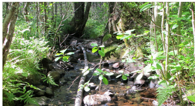
Bäck vid Laxtjärn

Bäckarna bedöms ha naturvärdesklass 4, dvs. visst naturvärde.