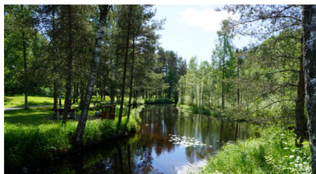
Grillplats i Rydbergsdal

I Rydbergsdal finns även sittplatser, grillplatser och mindre planteringar samt öppna gräsytor.