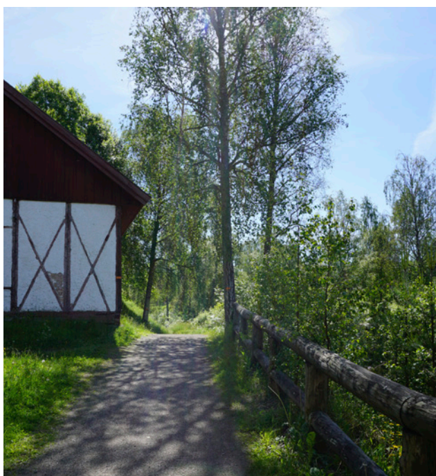
Stig längs Garhytteån