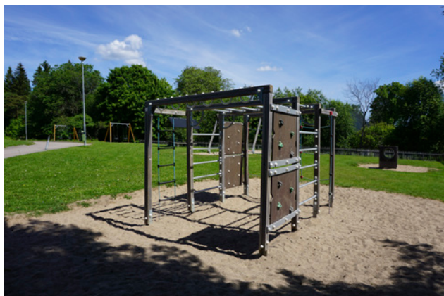
Lekplats vid Kyrkbacksskolan

Lekplatsen vid Kyrkbacksskolan inventerades i fält år 2015 och pekades ut i skolenkäten från år 2007. Lekplatsen omfattar bl.a. klätterställning och gungor.