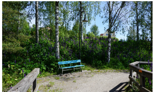
Sittplats längs Garhytteån

För att fler ska kunna ta del av områdena och de värden som finns inom dem ska det finnas fler sittplatser. Sittplatserna bör placeras strategiskt inom områdena, exempelvis vid naturliga mötesplatser, utsiktsplatser eller som viloplats i långa sluttningar.