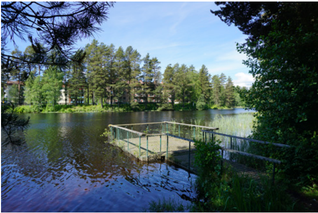
Fler mindre bryggor bör anläggas längs Garhytteån

För att förstärka vattenkontakten ytterligare bör mindre bryggor anläggas på strategiska platser längs Garhytteån, främst inom den norra delen av ån.