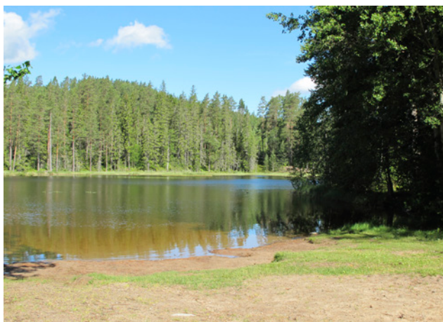
Badplats vid Laxtjärn

Områdena är relativt lätta att nå, men kvaliteten på områdenas rekreativvärden bedöms vara låg. Badplatserna bedöms ha rekreativvärde klass 2, dvs. vara värdefulla för tätorten.