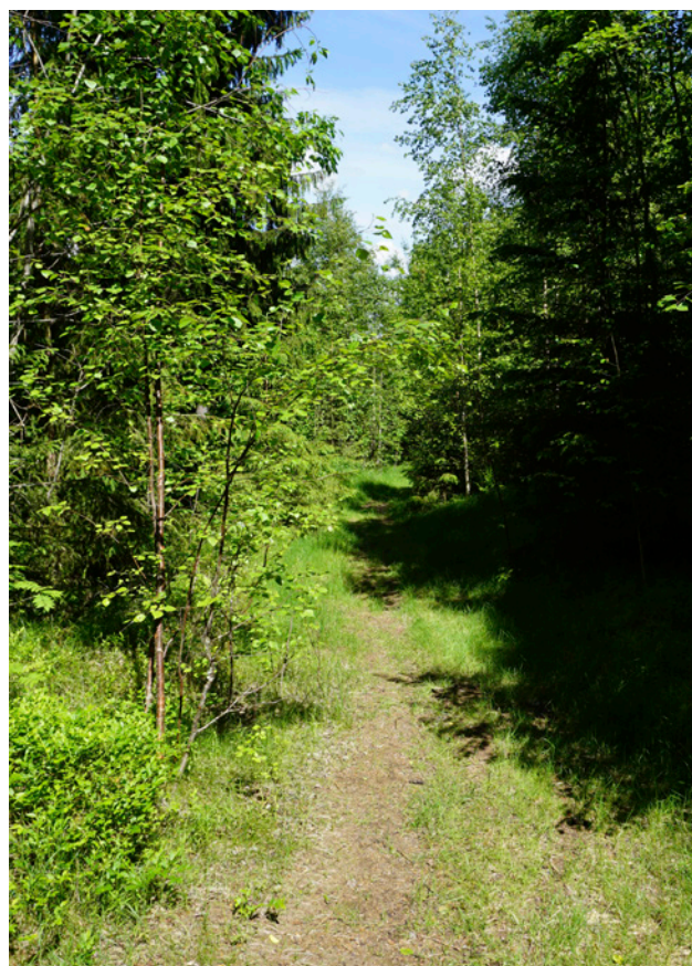
Stigarna inom området bör utmarkeras

Skyltar bör sättas upp med information om de kulturvärden som finns inom området.