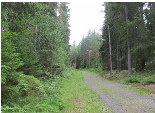
Elljusspår i naturreservatet Finnkullberget

Majoriteten av de som besvarade frågan vistas främst i Rydbergsdal, skogen och elljusspåren. Vidare är det även många som vistas i Finnkullberget, vid Djäkens och Laxtjärn.