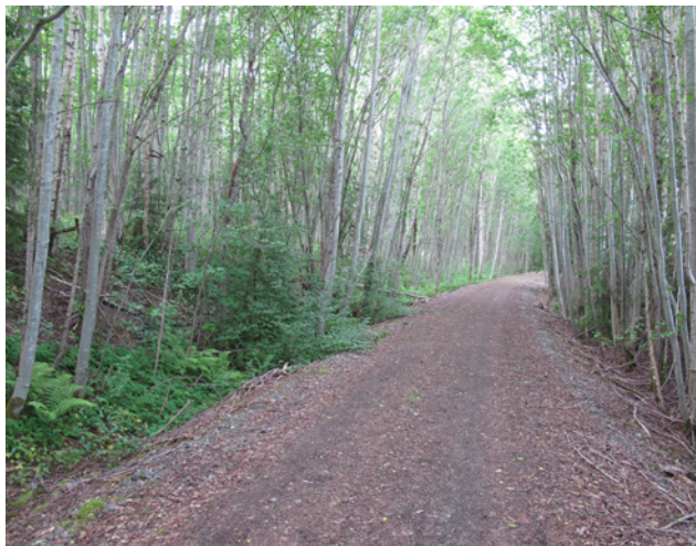
Lönnskog vid Daltorp

Ängsmarkerna bedöms ha naturvärdesklass 4, dvs. ett visst naturvärde.